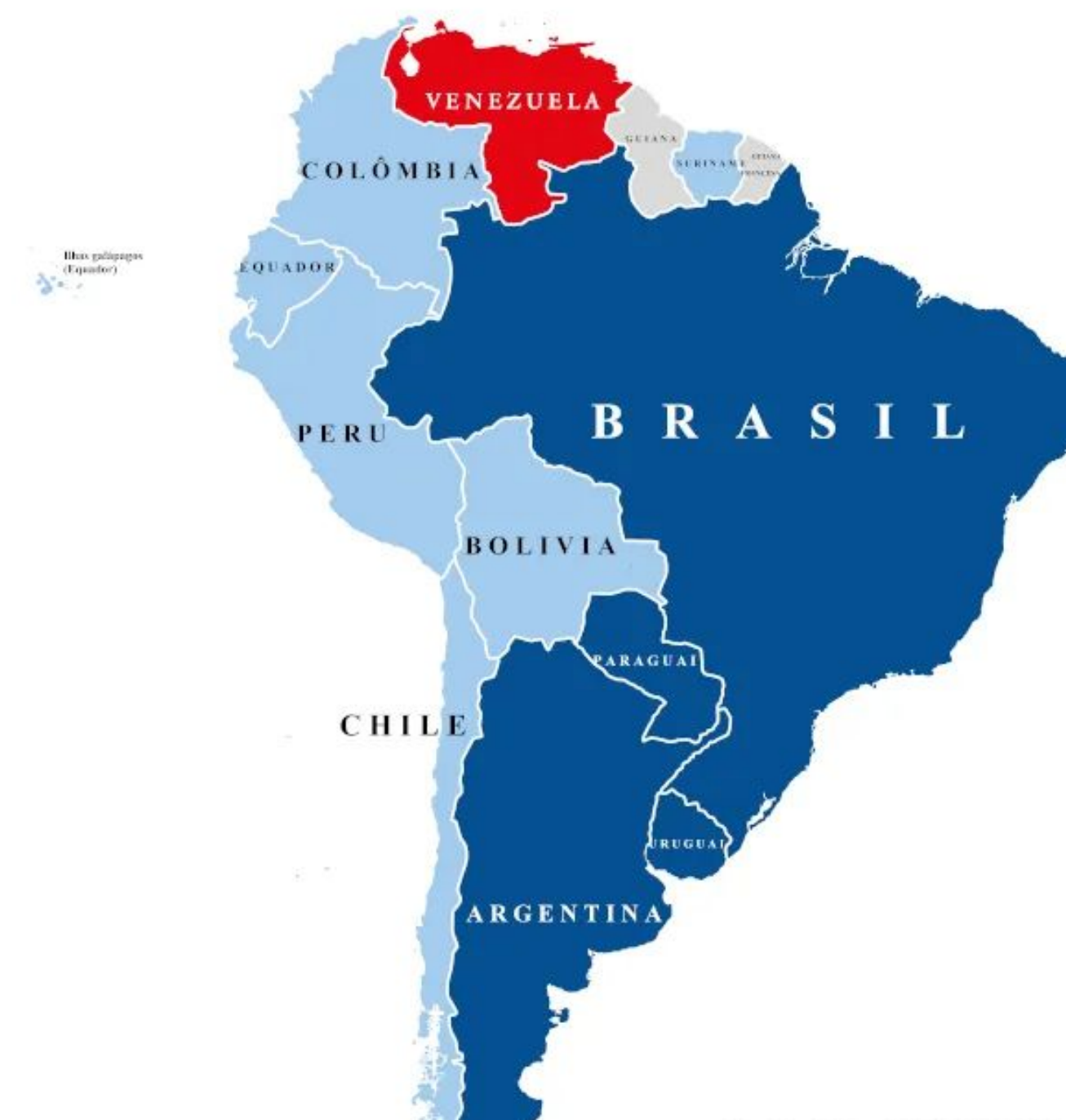
países com isenção de visto para entrar no Brasil