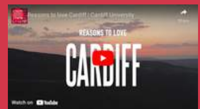
Reasons to love Cardiff - 1.05 mins