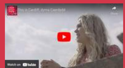
This is Cardiff - 1.46 mins