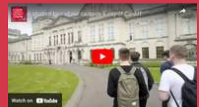
Student campus tour - 1.38 mins