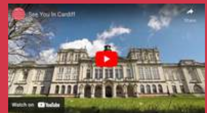
See you in Cardiff - 2.42 mins