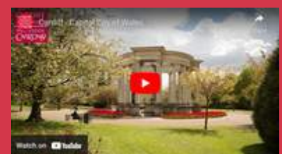
Cardiff - Capital of Wales - 1.35 mins